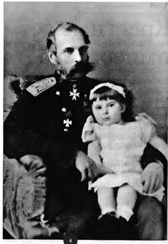
Среди восьми восприемников сына московского градоначальника графа П.П. Шувалова Петра, крещенного в соборе 18 октября 1905 г., была родная сестра супруги Николая II великая княгиня Елизавета Федоровна.