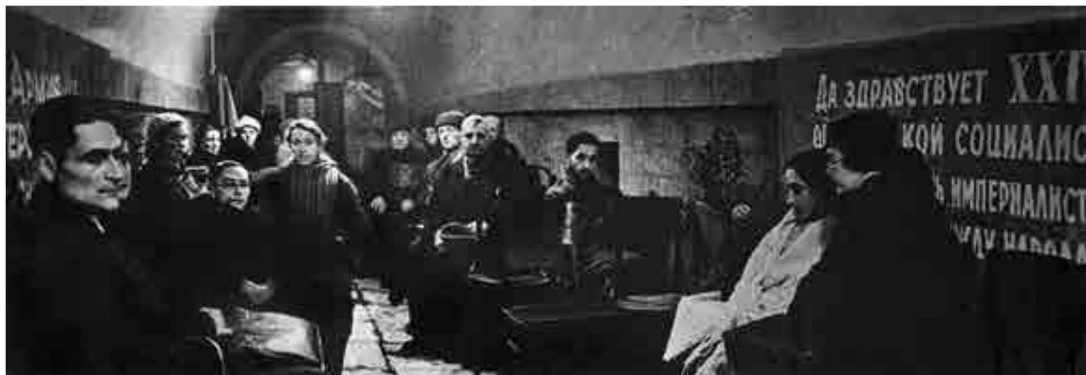
Праздничное собрание сотрудников 7 ноября 1941 г.