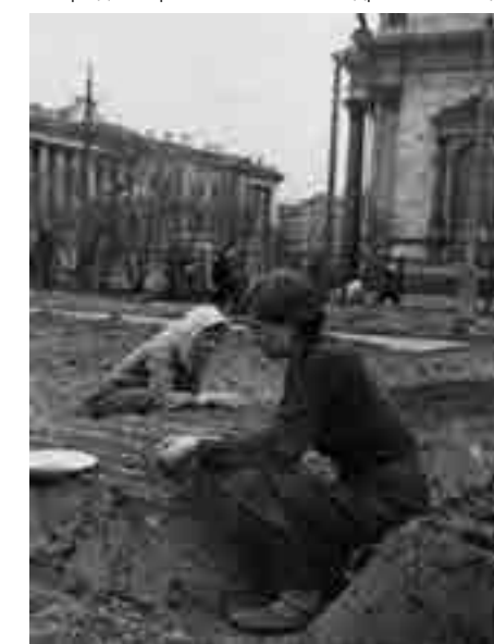
Огородные работы в Александровском саду

го дня войны и были окончены к 9 июля 1941 года. Общая площадь работ составила 2600 кв. м. Пять куполов собора были покрыты защитной шаровой краской. Масляная краска серо-голубого, дымчатого цвета, которую использовали