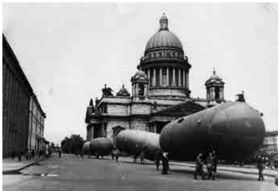
Газгольдеры у Исаакиевского собора

Фондовые предметы самого ГАМа, Музея истории и развития Ленинграда, Летнего дворца и Домика Петра I, а также