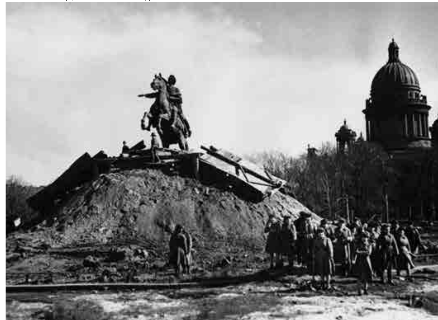
Снятие защитного укрытия с памятника Петру I

и надежное укрытие. Были учтены особенности архитектурного памятника: толщина сводов и стен, доходящая до пяти метров, а также достаточно глубокие подвалы на массивном основании. Кроме того предполагалось, что разрушение подобной реперной точки, удобной для пристрела (высота собора вместе с крестом – 101,5 м), не будет являться целью дальнобойной артиллерии врага.