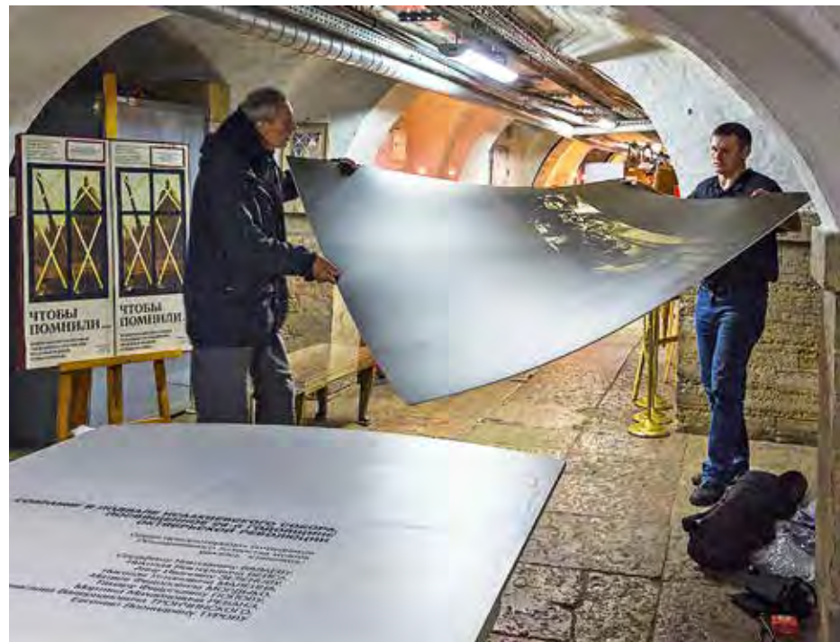
Реконструкция кабинета главного хранителя. Фрагмент экспозиции. Фотография 2023 г.

Настал январь 1944 г. Каждый день приносил радостные вести. 19 января был освобожден Петергоф, в последующие дни – Пушкин, Павловск и Гатчина. Сразу после полного снятия