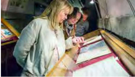
Посетители выставки во время экскурсии. Фотография 2023 г.