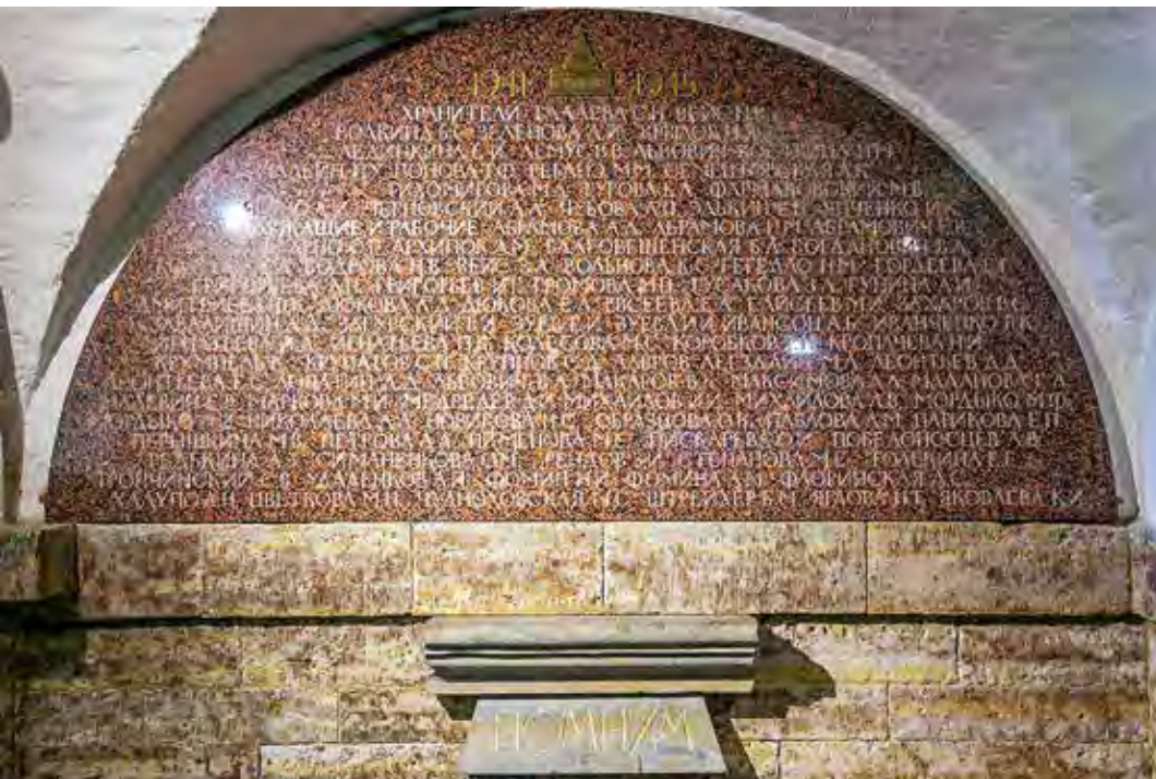
Мемориальная гранитная доска с именами сотрудников Объединенного хозяйства музеев. Фрагмент экспозиции. Фотография 2023 г.

Уже 20 лет мемориальная экспозиция в подвальном помещении Исаакиевского собора вызывает неподдельный интерес у жителей и гостей Санкт-Петербурга.