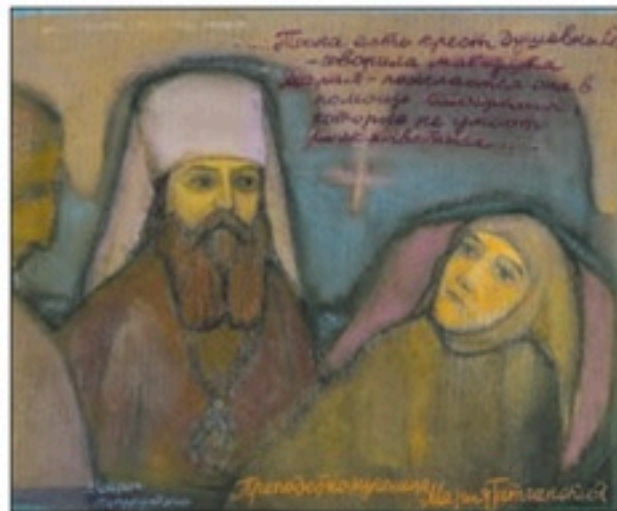
Святой праведный Иоанн Кронштадтский. 60 × 42. ■ Преподобномученица Мария (Лелянова) Гатчинская, монахиня. 48,5 × 61.